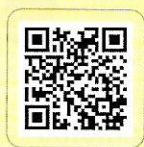
"Leyenda del picaflor".

Miren el video de "La leyenda del picaflor", que forma parte de la serie El taller de historias , emitida por Pakapaka . Se encuentra disponible en bit.ly/L5C1p23 . ¿Qué aspectos del relato se presentan visualmente? ¿Cómo podrían presentarse esos aspectos en un texto?